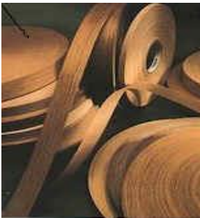
Bandes de chants