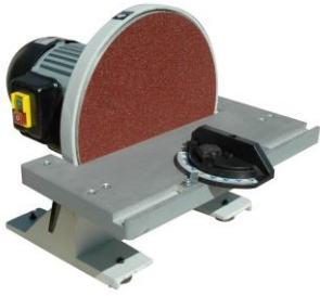
Sableuse de bouts