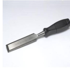
Ciseau à bois