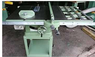
Banc de scie