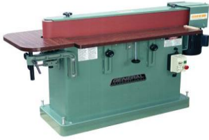
Sableuse de chants