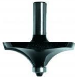
Couteau de toupie