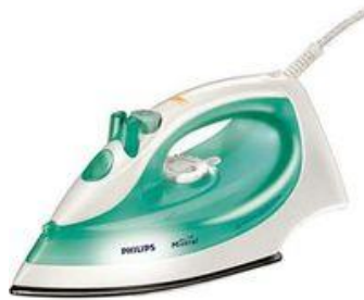
Fer à repasser