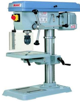
Perceuse à colonne