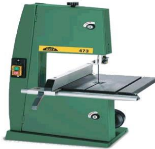
Scie à ruban