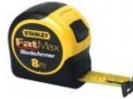
Ruban à mesurer