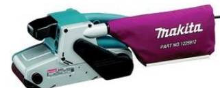
Sableuse à ruban