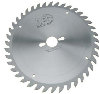
Lame de scie