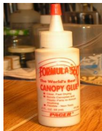
Colle à bois