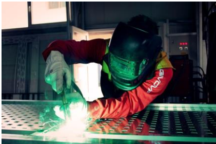
Soudeur D.E.P. offert au Campus Brome-Missisquoi