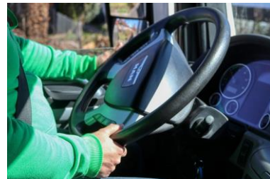
Transport - conduite de camion DEP offert au Campus Brome-Missisquoi