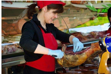
Boucherie DEP offert au Campus Brome-Missisquoi