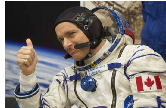
David St-Jacques, ingénieur, astrophysicien et médecin de famille