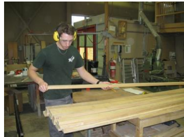
Opérateur de production DEP offert au CRIF