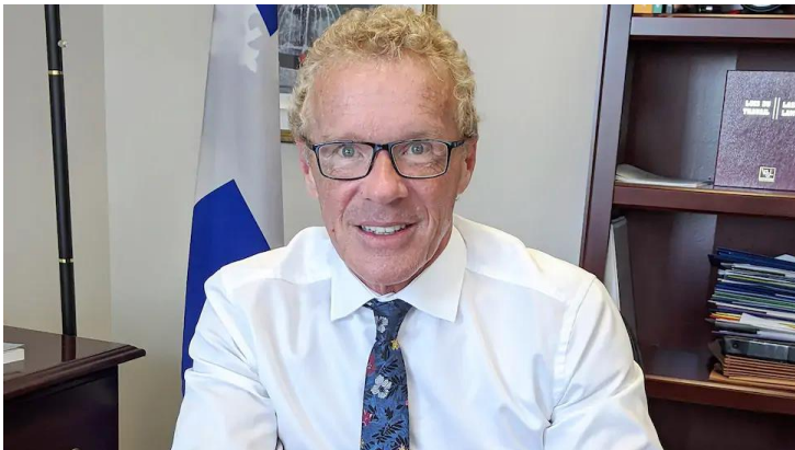
Jean Boulet, ministre du travail

Bref, tout n'est pas noir sur le marché du travail actuel. Jean Boulet, ministre du travail, admet toutefois dans l'édition du samedi 29 août du Journal de Montréal, « qu'il y a des personnes qui vont devoir passer d'un secteur au chômage à un secteur en besoin ». Il ajoute que la formation sera l'élément-clé de la relance de l'emploi.