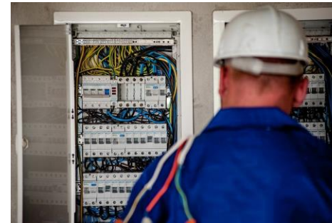
Électricien DEP offert au CRIF