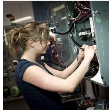
Mécanique industrielle DEP offert au Campus Brome-Missisquoi