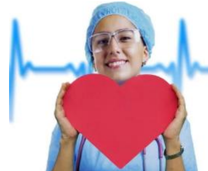
SANTÉ Formations préposé en établissement, à domicile et infirmier-auxiliaire offertes au CRIF