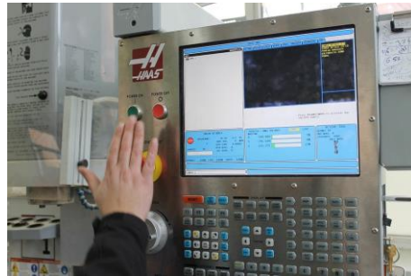
Opérateur de machines à commandes numériques DEP en usinage avec spécialisation offert au Campus Brome-Missisquoi