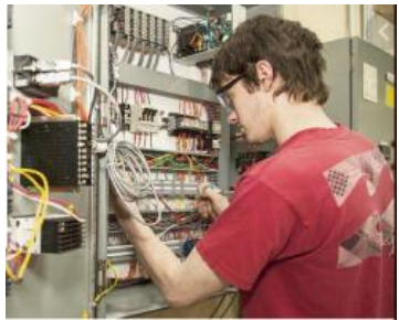
Électromécanicien D.E.P. offert au CRIF