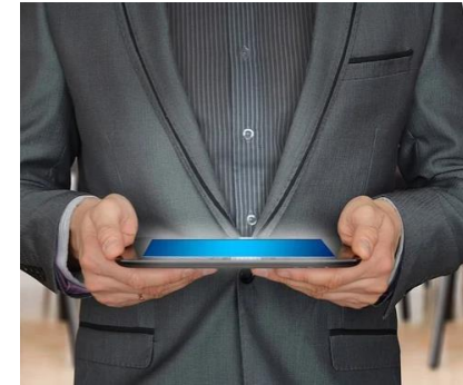
Conseiller-vendeur spécialisé ASP en représentation offerte au CRIF