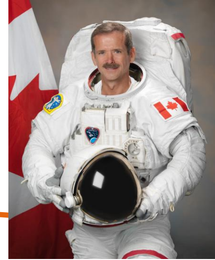
Chris Hadfield - astronaute canadien