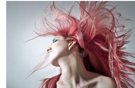
Coiffure DEP offert au Campus et au CRIF